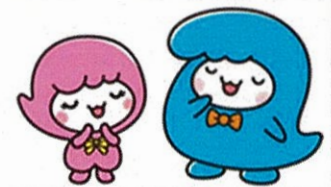
あらみい あらかわ