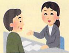
役所や銀行の手続き